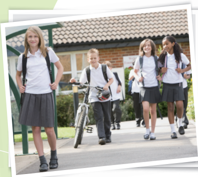
Junior High School