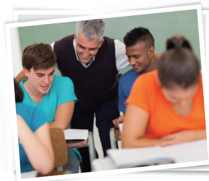
Senior High School

우리는 중학교를 middle school이라고 해석해서 자주 쓰지만, 사실 이것은 미국에서는 잘 쓰이지 않는 말입니다. 우리의 중학교에 해당하는 미국의 학교는 보통 junior high school이라고 부릅니다. 그 이유는 초, 중, 고등학교에 관한 제도가 약간 다르기 때문입니다.